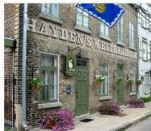
Ginette Venable - Un beau jour