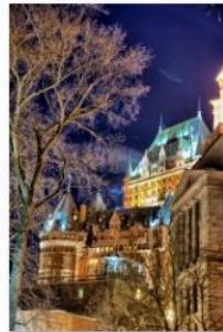
Christian Fortin - Nuit froide d'hiver