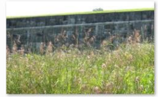
Benoît Bossé - Herbes folles