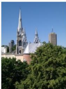
Sophie Houle-Drapeau - Vue du Cavalier du Moulin