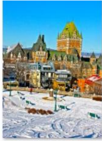
Allison Van Rassel - Première neige sur Québec 2010