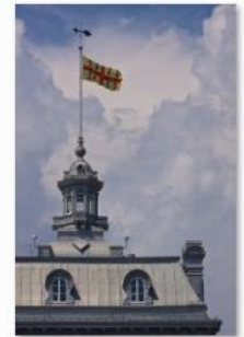
Paul-Émile Auger - Gratia Dei - Les cieux & le Séminaire