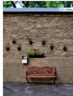
Frédéric Fortin - Jardin suspendu