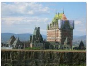
Pia Wagner - Plus haut qu'une citadelle