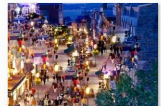
Hela-Zahar - Impression soleil couchant de la rue Saint Jean et du fleuve Saint-Laurent