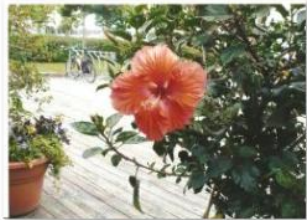
Nicole Poulin - Vel-o-fleur