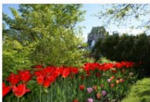
Gilles Dudemaine - Tulipes au Cavalier-du-Moulin