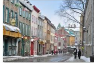
Justine Cotton - Québec Divers