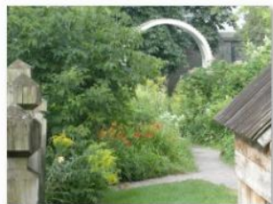
Pierre Bilodeau - Un jardin au coeur du patrimoine de Québec