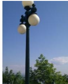
Danielle Boulé - L'empreinte de Baillargé