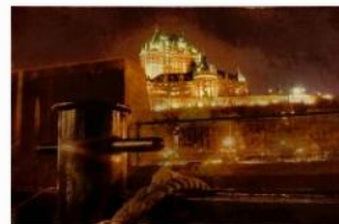
Denis Larocque - Histoire de lien