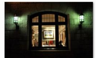
Feriel Helioui - Par la fenêtre du Château Frontenac, j'admire la nature