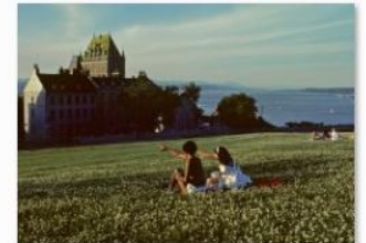
Gilles Chamberland - Visite guidée au jardin du patrimoine