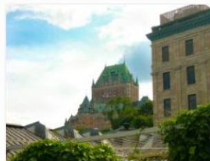
Guillaume Simard - Jardin des visionnaires