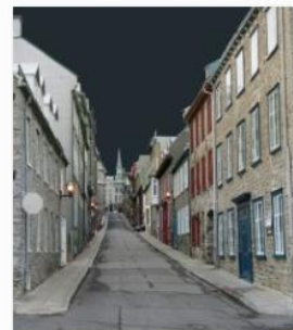
Urek Wyder - Rue Ste-Famille